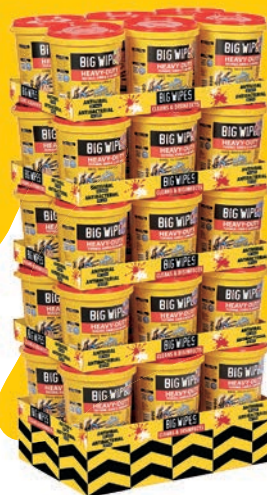
Quart-palette de seaux sur plateaux 30 seaux