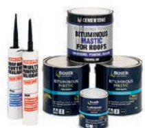
GOUDRON ET BITUME