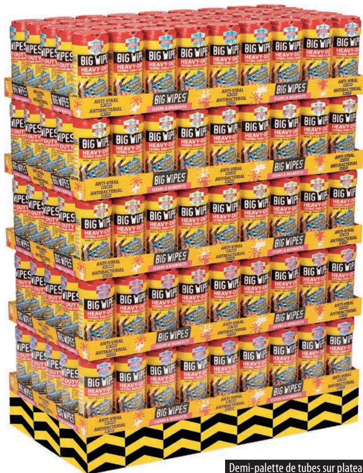
Demi-palette de tubes sur plateaux 225 tubes