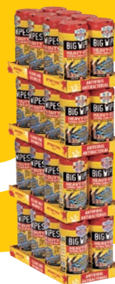
Pile de tubes 32 tubes