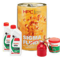
HUILE ET GRAISSE