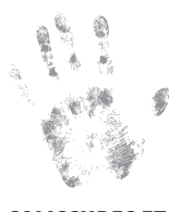
SALISSURES ET SOUILLURES

Plus de gaspillage, aucun souci, rapidement et efficacement