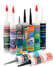
MASTIC ET SILICONE