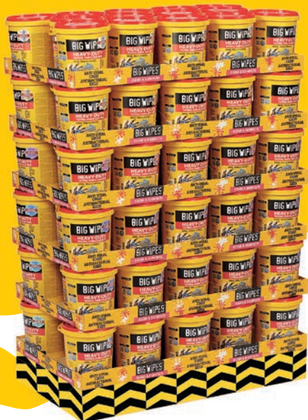
Demi-palette de seaux sur plateaux 84 seaux