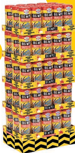
Quart-palette de tubes sur plateaux 75 tubes